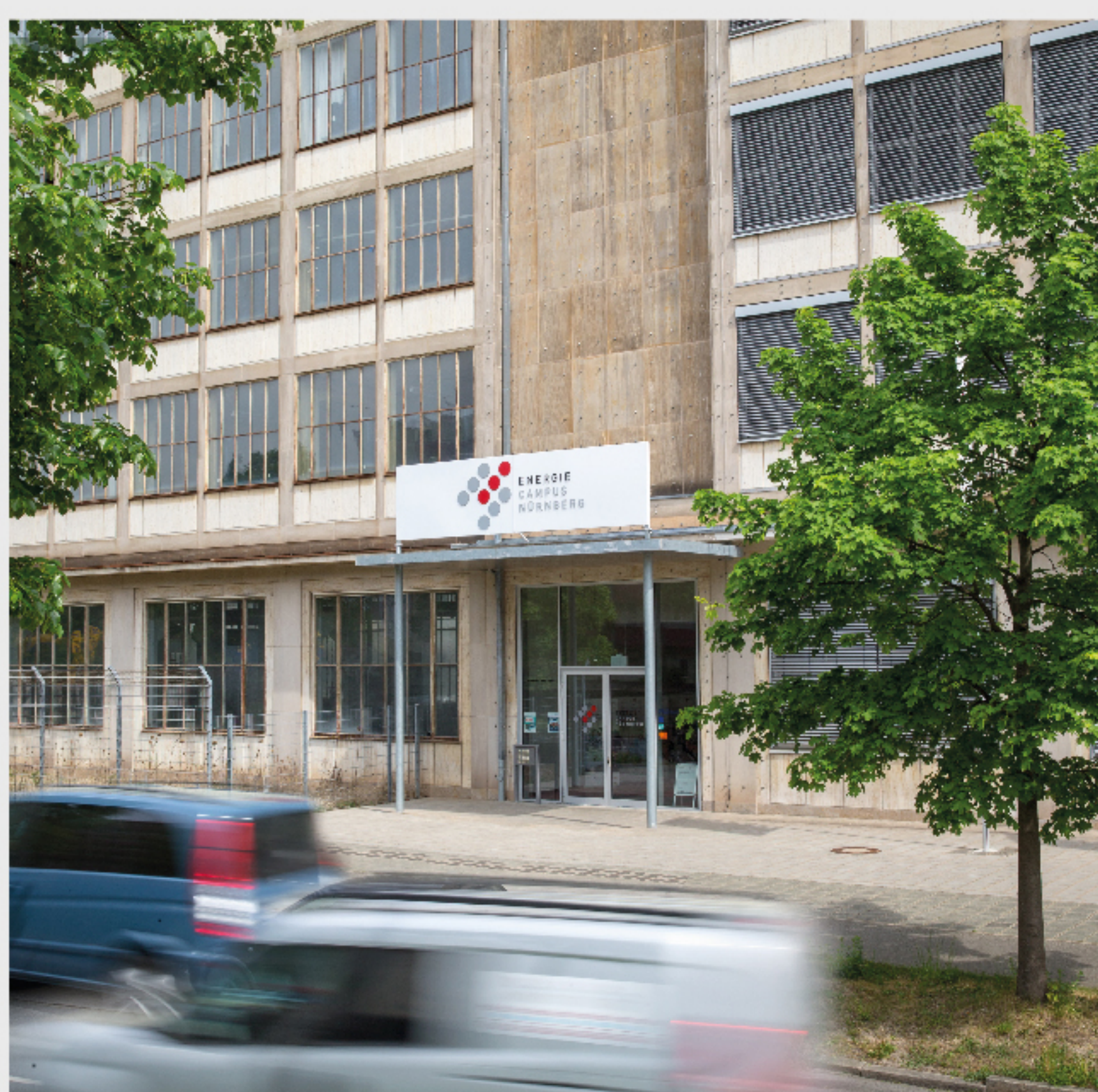
Haupteingang EnCN, Fürther Str. 250

VON NBG HBF (10 min)/ MESSE (19 min): U-Bahn Linie U1 (5-10 min Takt) Richtung Fürth Ausstieg Eberhardshof in Fahrtrichtung Ausgang Raabstraße